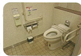
①出雲まがたまの里伝承館1階 (※写真は女子トイレ)