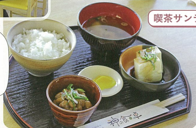
一日30食限定! 三朝産神倉大豆の納豆と豆腐の付いた納豆かけご飯食べ放題(540円)

駐車場から段差はなく、お土産コーナーと喫茶スペースが同じ空間にあります。納豆ごはん食べ放題は納豆だけのおかわりもできて嬉しい! 大粒の納豆で濃厚な味わいでした。(かなこ)