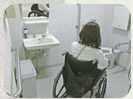
②ふるさと健康むら (喫茶サンテ)