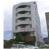
松江アーバンホテルレークイン 松江雑賀町153 TEL0852(21)2424