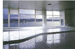
松江ニューアーバンホテル別館3F 松江しんじ湖温泉展望大浴場