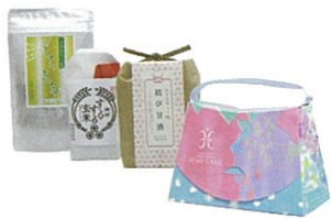
姫ラポのHime Bag (ミニ石けん&ミニゲル) & 八百万マーケット (結び甘酒、するする玄米、もち花茶)