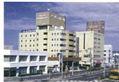
松江アーバンホテル 1号館2号館 松江市朝日町590-3 TEL0852(22)0002