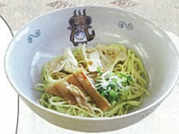
元祖ラードン麺(並 450円)

三朝のB級グルメ『ラードン麺』は温泉水でゆでた麺だそうで、汁なしなのでさっぱりしています。お好みで酢・ラー油・胡椒をかけられるのですがこれがまた美味でした。(むらまつ)