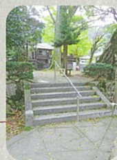
階段の先に飲泉場