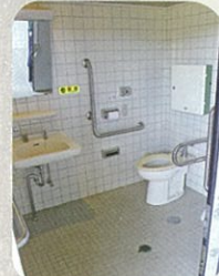
①ふるさと健康むら (屋外)