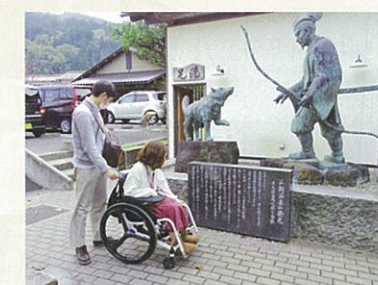
白狼の恩返し銅像

浸かってよし、飲んでよし、吸ってよし。心と身体を癒してくれる、三朝の湯。温床暖房を持った長期滞在者向けの旅館や自炊宿も見られ、『観光』と『療養』という両極性がこの温泉の特徴である。時間があれば、一週間位ゆったりと静養に滞在したいものだ。身体の芯から健康になる事、間違いなさそうだ。