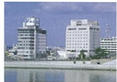
松江ニューアーバンホテル本館・別館 松江市西茶町40-1 TEL0852(23)0003