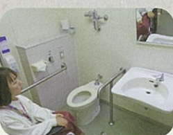
⑤ブランナルみささ