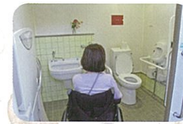
③おすそわけ茶屋近くの公衆トイレ (オストメイト対応多目的)