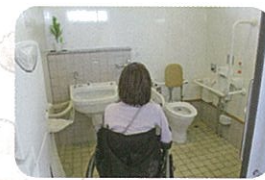
②玉造温泉駅 (オストメイト対応多目的)