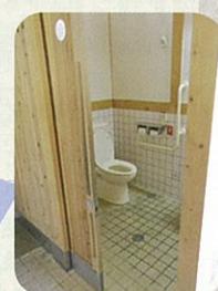
④恋谷橋付近の公衆トイレ (男性トイレ)