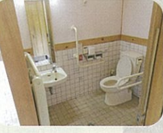
④恋谷橋付近の公衆トイレ (女性トイレ)