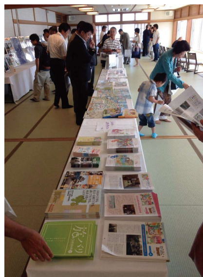
10年分の成果物を展示