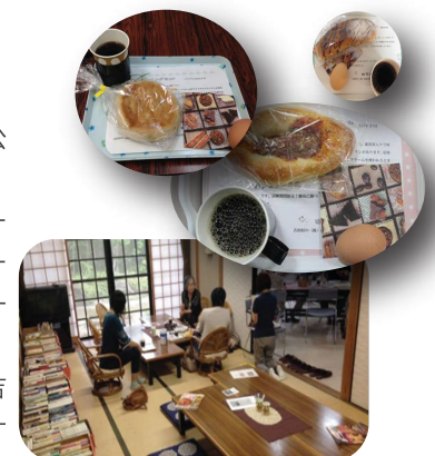
モーニングブックカフェの様子

モーニングセットは250円!【月ごとに変わる「館長おススメの珈琲」「パンエールのパン」「吉田町たなべのたまごを使ったゆで卵】懐かしい音楽が流れる中、ゆうあい選りすぐりの本を片手に、ゆったりとした時間を過ごしてみませんか。城北公民館でお待ちしています!