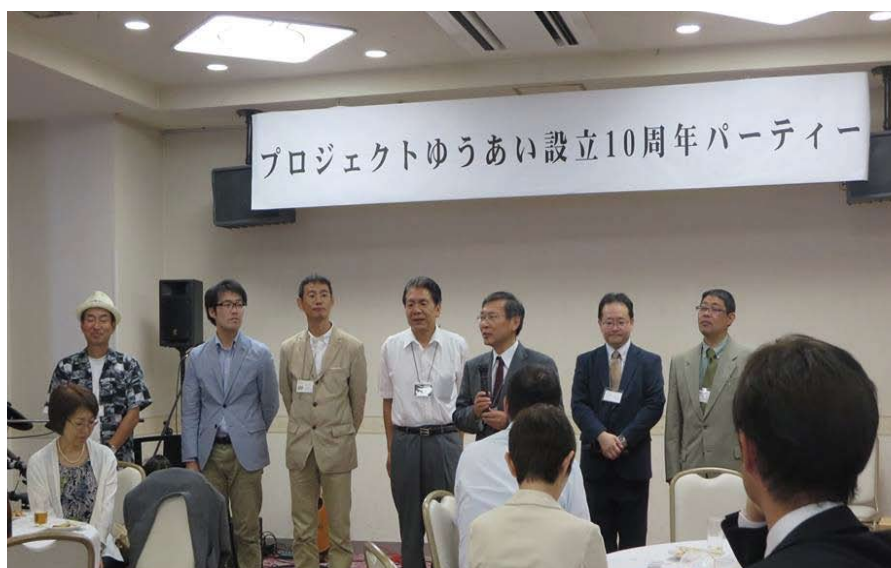
10周年記念パーティー理事一同

私たちは、障がい者、健常者のへだてのない、誰もが自立して豊かに暮らすことができる新しい社会の仕組みづくりに取り組んでいます