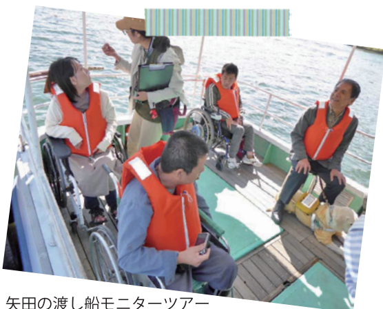
矢田の渡し船モニターツアー

松江市が制定した「松江市障がい者差別解消条例（2016.10～）」の中の1つとして「バリアフリー観光の推進」が位置付けられています。障がいのある方たちが安心して快適に観光できる体制づくりが今後加わっていきそうです。（川瀬）