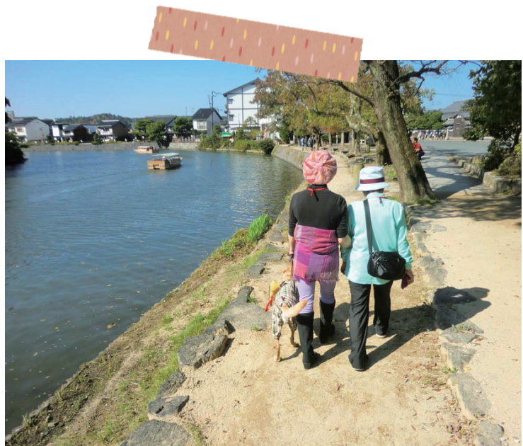
盲導犬ユーザーの視覚障がいの方が松江の堀川沿いを散歩