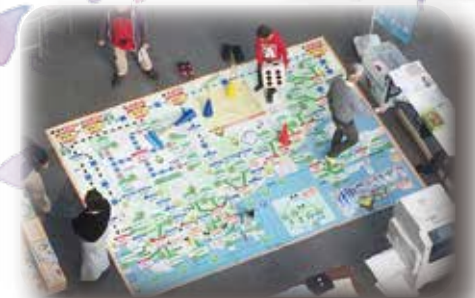
巨大どこでもマップすごろく