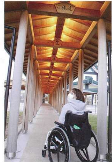
人生の節目にご縁のある、32の文字が書かれている「ご縁道」