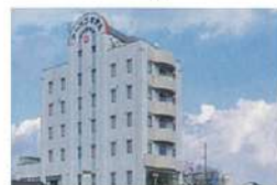
松江アーバンホテルレークイン R9沿い・松江駅から徒歩7分 TEL (0852) 21-2424