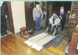
※持参したスロープを使用