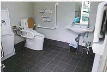
駐車場 (オストメイト対応)