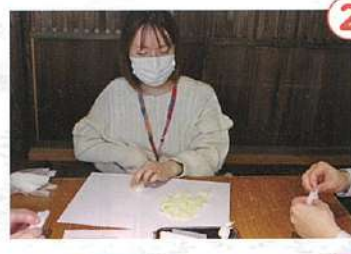
生姜糖を紙で包む