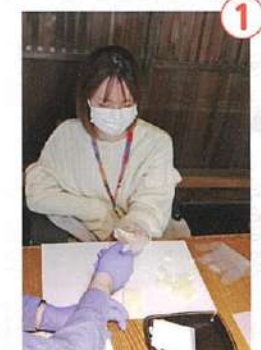
生姜糖を一口サイズに折る