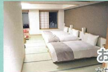
パリアフリールーム