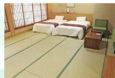
2F 和洋室「すみれ」(上) 洗面所・風呂・トイレ (下)