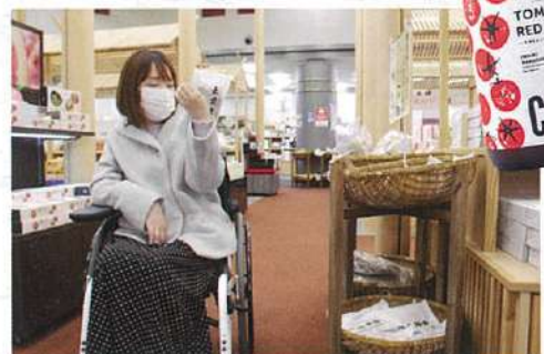
広い空間に出雲地方のお土産物や地酒など多数並ぶ