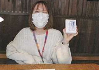
生姜糖パッケージの完成! →