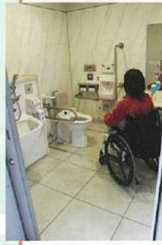
古代出雲歴史博物館1階 (オストメイト対応)