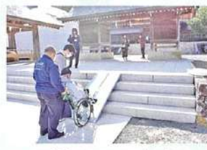
※持参したスロープを使用

境内に上がる4段の階段は持参した簡易スロープを掛けて上がることができました。神社に備え付けのスロープはないので、車いすでの突然の参拝は難しいと思います。玉砂利のところは車いすでは進めないのので杖をつけて歩きました。拝殿は10段の階段なので、階段の下から参拝しました。(さとる)