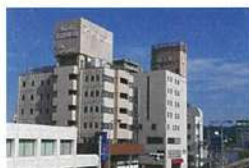
松江アーバンホテル JR松江駅から徒歩3分 TEL (0852) 22-0002