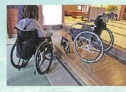
土足不可につき、館内用車いすに乗り換える