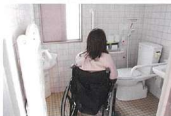
きづき海浜公園 (オストメイト対応)