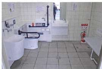
道の駅ご縁広場・出雲物産館 駐車場 (オストメイト対応・ユニバーサルベッドあり)