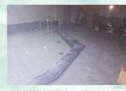
大浴場の浴室に手すりあり