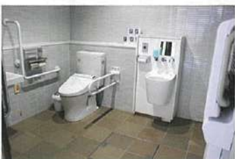
庁舎内 (オストメイト対応)