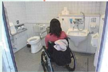
古代出雲歴史博物館駐車場 (オストメイト対応)