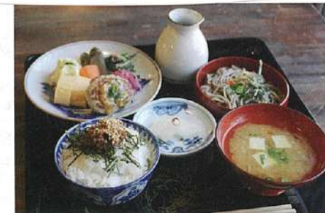
蕎麦御膳(割子一段)1,000円(税別)