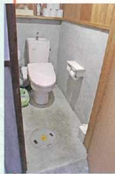
大社門前 いづも屋