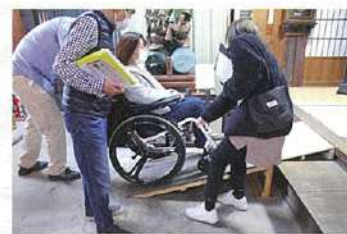
簡易スロープあり