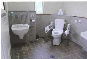
縁結びスクエア (オストメイト対応)