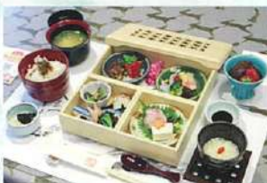
美肌膳たまたま箱 (2,800円)