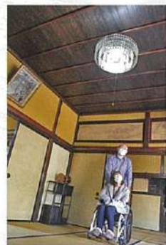
和室にシャンテリアの珍しい組み合わせ