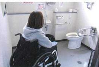
道の駅ご縁広場・出雲物産館 館内