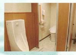
館内手すり付き洋式トイレ