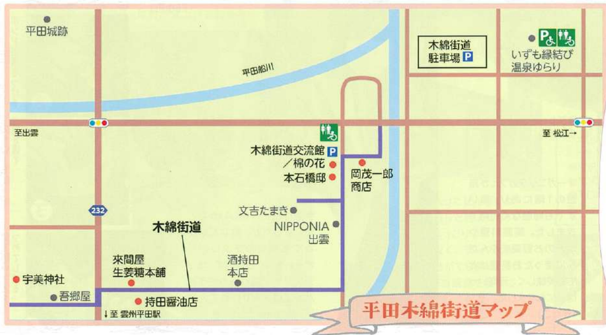
平田木綿街道マップ