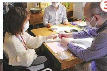
両手の作業はフォローしてもらいながら