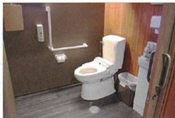
ねがい雑ミュージアム IZUMONO-en