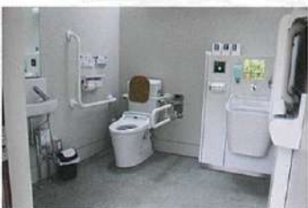
三の鳥居付近 (オストメイト対応)