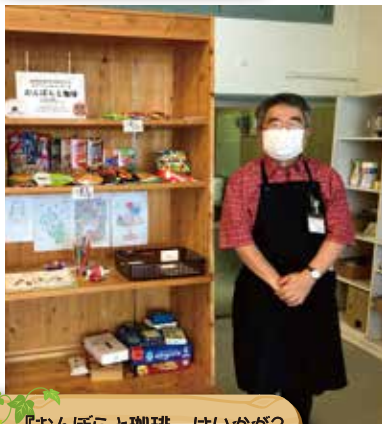
『おんぼらと珈琲』はいかが？

プロジェクトゆうあい本館の2軒隣り、ゆうあい別館1階に地域活動支援センターゆうあい「おんぼらとステーション北堀」が運営を開始しました。新型コロナの影響もあり、当面はプロジェクトゆうあい利用者・関係者に絞ったの利用に限定していますが、脱コロナの暁には、障がい者・健常者の隔てのない地域交流の場・地域のくつろげる居場所として一般オープンを目指します。センターとしては、そのほか、障がい者の方たちの創作・生産活動、社会適応訓練の場などの機能を有しており、古本、お菓子や飲み物などの販売も行っています。おすすめは、スペシャルコーヒー『おんぼらと珈琲』！！豆から挽いた美味しいコーヒーは、木の温もりある店内の雰囲気と相まって、ホッと、くつろぎのひと時をもちたしてくれそうです。（開店：月～金 10～17時、第1・3土 11～17時）