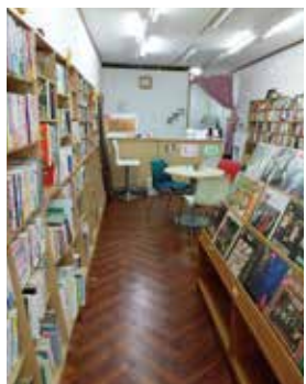
古本販売のスペース

本町堂には二つの顔があります。一つは中間就労の場として学校に行きづらい、働く場所を探しているというような若者(15～39歳)を一般就労につなげる訓練の場として古本屋を運営しています。本の手入れや接客などをして社会に一步踏み出すお手伝いをしています。ほんの僅かですが、報酬が出ます。もう一つは居場所の提供です。のんびりしたい、誰かと触れ合いたい、そういう場を求める若者に、安心してゆっくり過ごせるスペースを提供しています。いつでも自由に入出りできるので、気軽に気持ちで立ち寄ってみてくださいね。 毎月何かしらイベントを開いているのですが、4月はお花見、5月は料理教室、6月は短歌講座で盛り上がりました。あなたも是非仲間になりませんか! (佐々木)