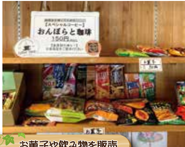
お菓子や飲み物を販売