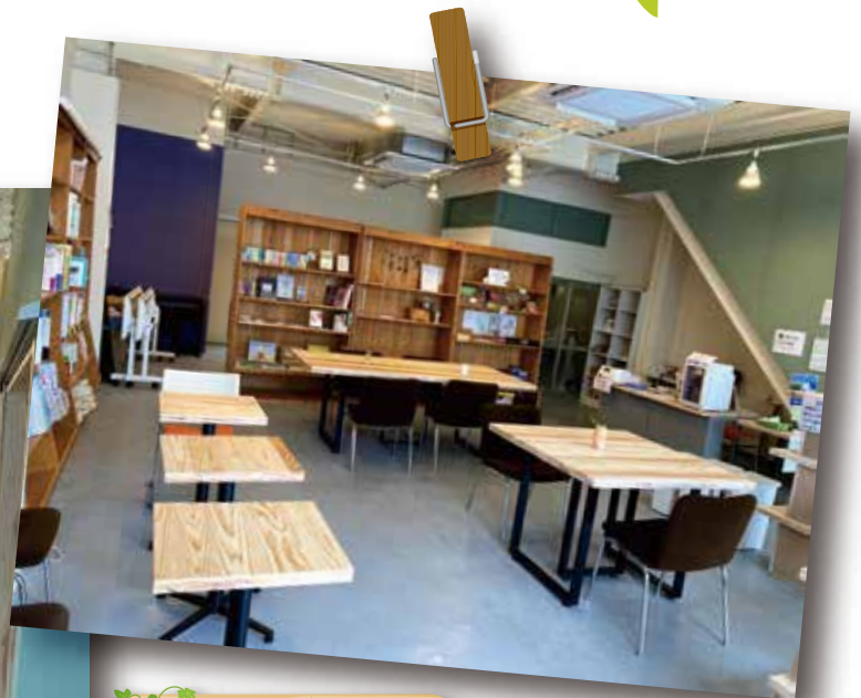
おんぼらとステーション北堀