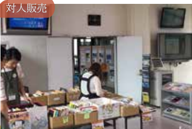
月に1回県庁「すまいる」出店