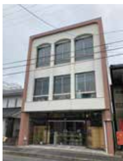
北堀郵便局隣のゆうあい別館に開設

放課後等デイサービス、就労系サービス（就労継続A型、B型、就労移行、就労定着）若者支援（本町堂）に続き、ゆうあいの新しい事業として相談支援事業を開設いたしました。お子さんから大人の方まで、ご相談をお受けいたします。