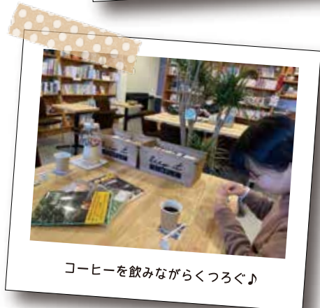
コーヒーを飲みながらくつろぐ♪