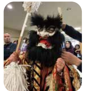
衣装やお面の試着