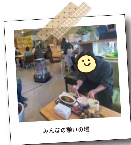
みんなの憩いの場