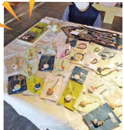
ハンドメイドアクセサリー