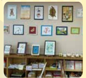
キッズ/ジュニアゆうあい作品展