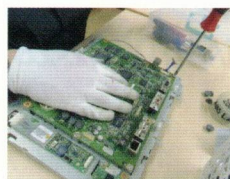
■ パソコンのリサイクル (分解作業)