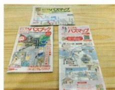
■ どこでもバスブック の制作