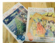
■ バリアフリーまち 歩き情報誌の制作