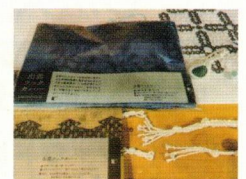
■ ブックカバー、 手芸品の制作