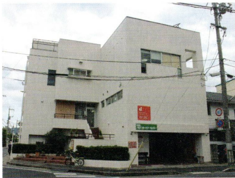
第1・第2プロジェクトゆうあい (ゆうあいビル)