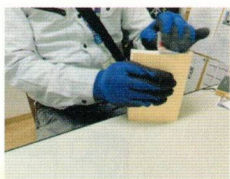
■ 古本のリサイクル (クリーニング作業)