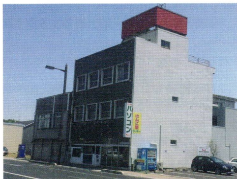
PCエコステーションゆうあい (1階部分)